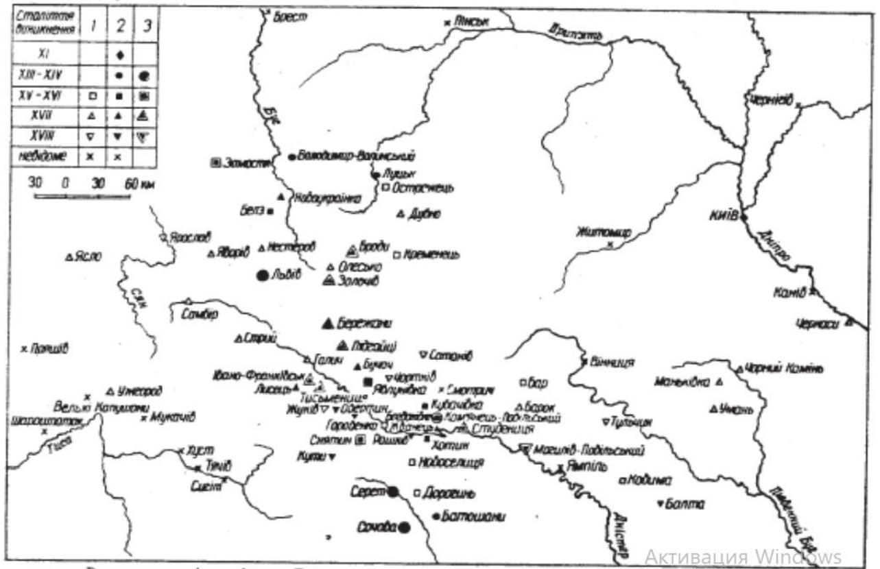
Розселення вірменів на Правобережній і Західній Україні та в сусідніх країнах: 1 - колонія, 2 - колонія з парафією, 3 - колонія з парафією та самоврядуванням.